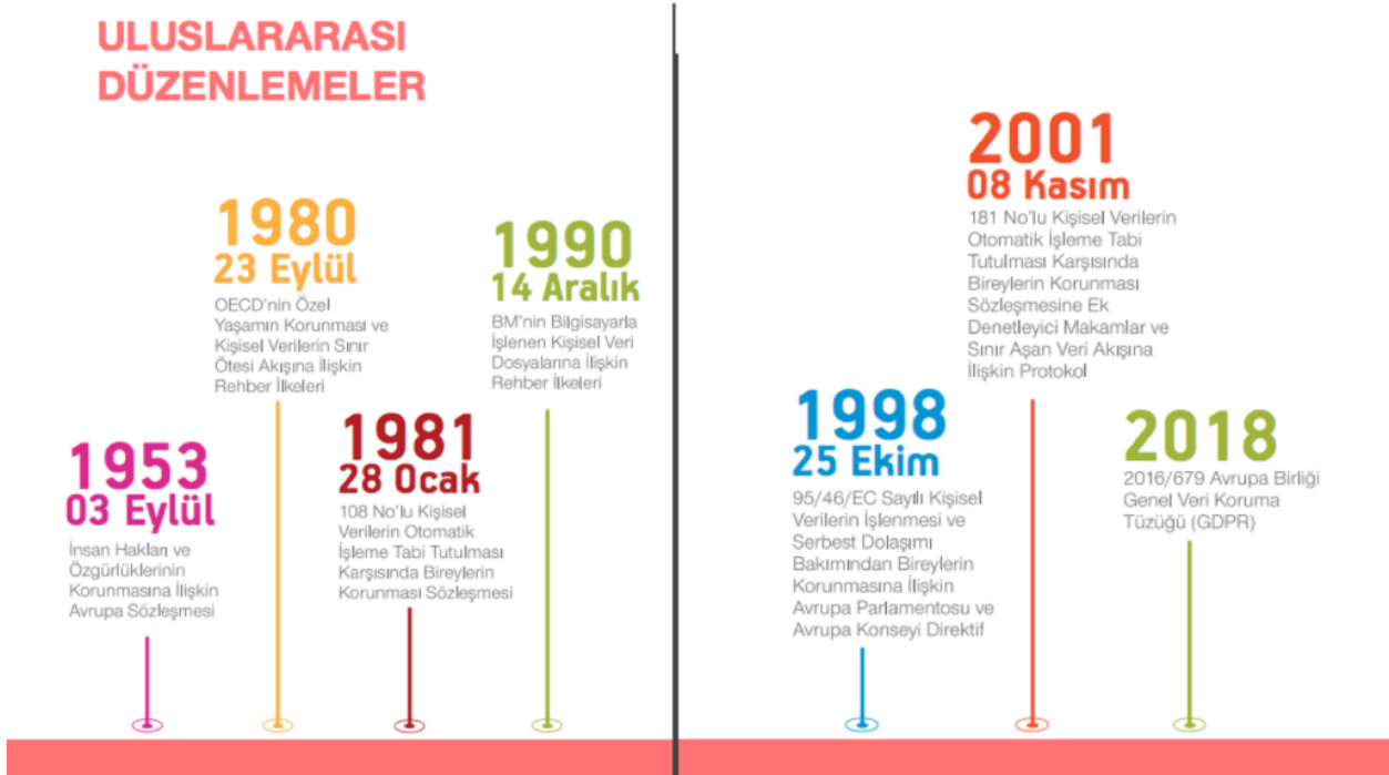
Şekil 5. Uluslararası Alanda Yapılan Düzenlemeler

20. yüzyılın ikinci yarısından başlayarak 21. yüzyılda artarak etkisini gösteren teknolojiye ki muazzam gelişmeler ekonomiden lojistiğe, siyasetten sosyal yaşantıya ve hatta düşünce yapımıza kadar birçok alanda günlük hayatımızı önemli ölçüde etkilemiştir. Bilginin her geçen gün dijitalleşmesinin yanında, sürücüsüz araçlar, nesnelerin interneti, küresel konum belirleme sistemleri, insansız hava araçları, yapay zekâ gibi pek çok yeni ve gelişen teknoloji de artan oranda kullanılmakta ya da yakın gelecekte kullanımı planlanmaktadır. Dijitalleşme kavramı da beraberinde hukuksal alanda da konuya ilişkin yeni düzenlemeler yapılması gereksinimini ortaya çıkarmıştır. Bu yüzden dijitalleşme ve kişisel verilerin korunması alanındaki düzenlemeler yakından ilgilidir.