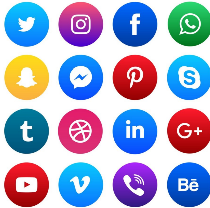
Şekil 4. İeriđi Yalnızca Kullanıcıların Kişisel Verilerini İçeren ve Bu Verileri Depolayarak İşlenebilmesi ve Aktarılabilmesine Olanak Sađlayan Platformlardan Bazıları

Teknolojinin gelişmesi ve kullanımının artması ile birlikte gerek kamu da gerekse özel kurum ve kuruluşlarda kişisel veri niteliđi taşıyan bilgiler uzun zamandır depolanmaktadır. Bu durum bir görevin yerine getirilmesine ya da bir hizmetin sunulmasıyla bağlantılı olarak bazen kişilerin rızasına veya bir sözleşmeye dayanarak, bazen de yapılan işlemin niteliđine bađlı olarak meydana gelmektedir.